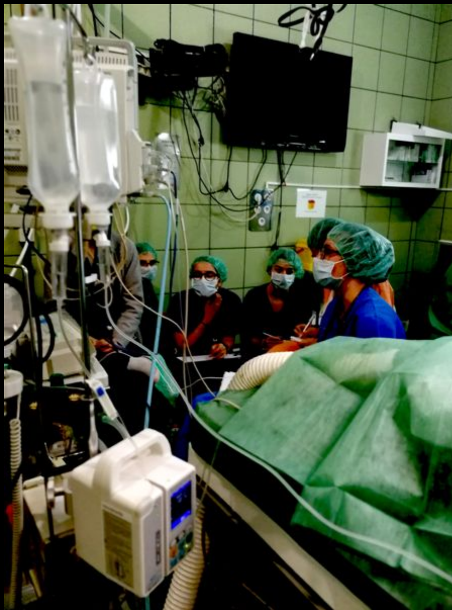
Equipo de anestesia.