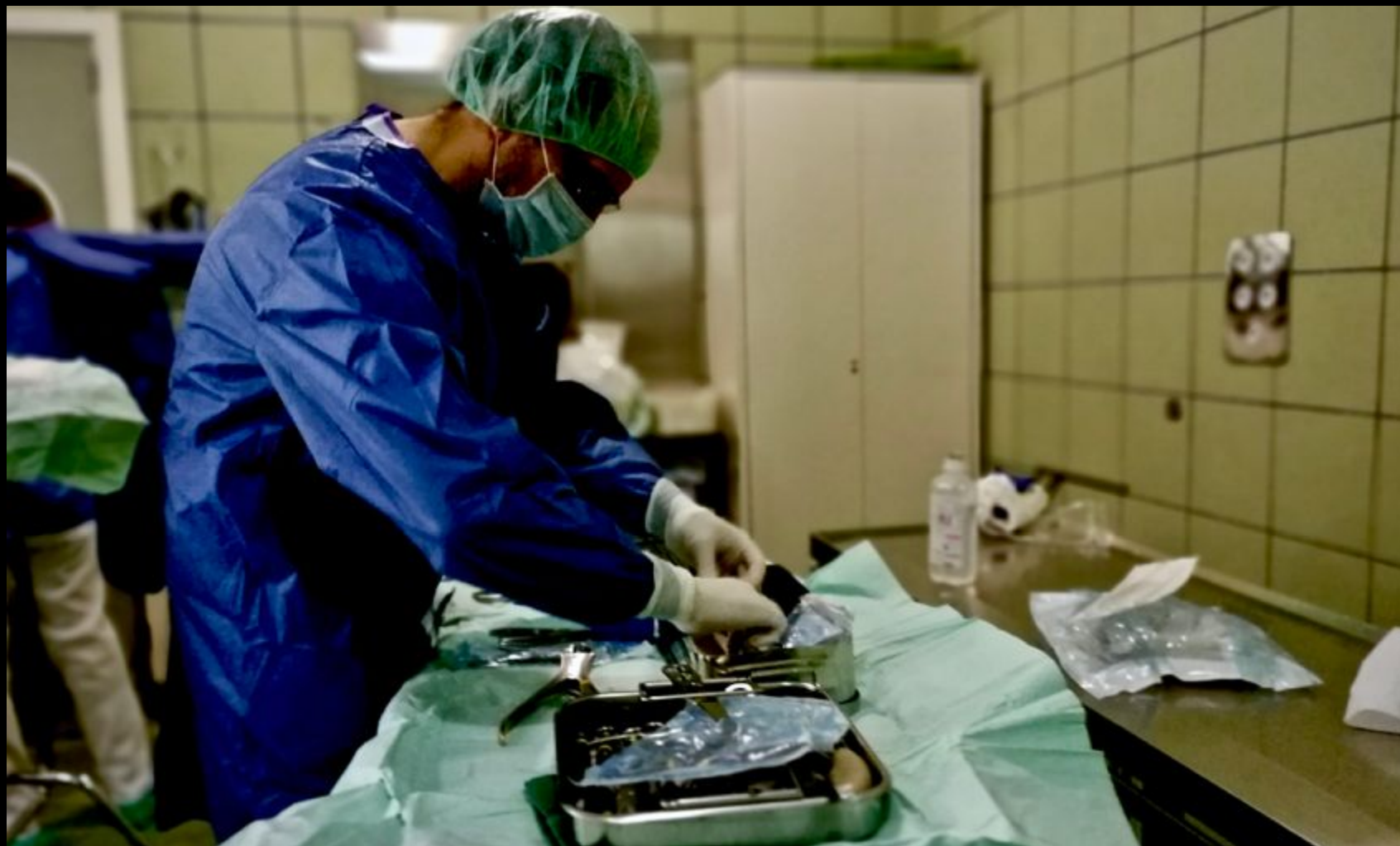
Preparación material de traumatología.