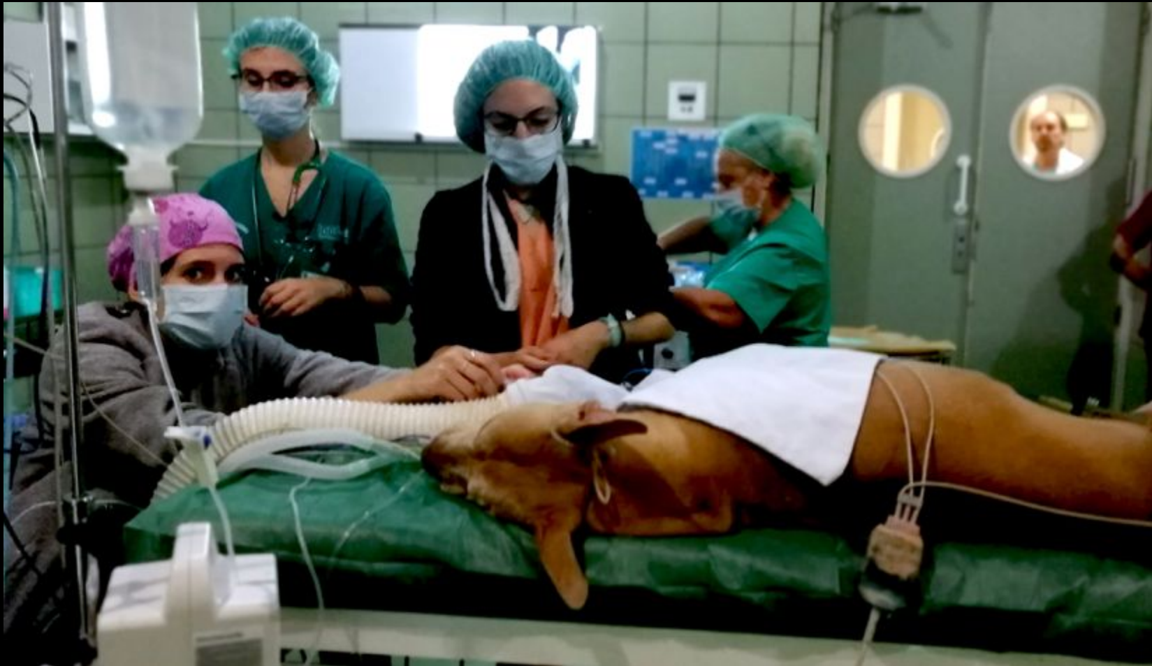
Fin de la operaci3n.