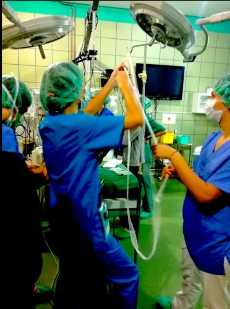
Sujeción de extremidad.