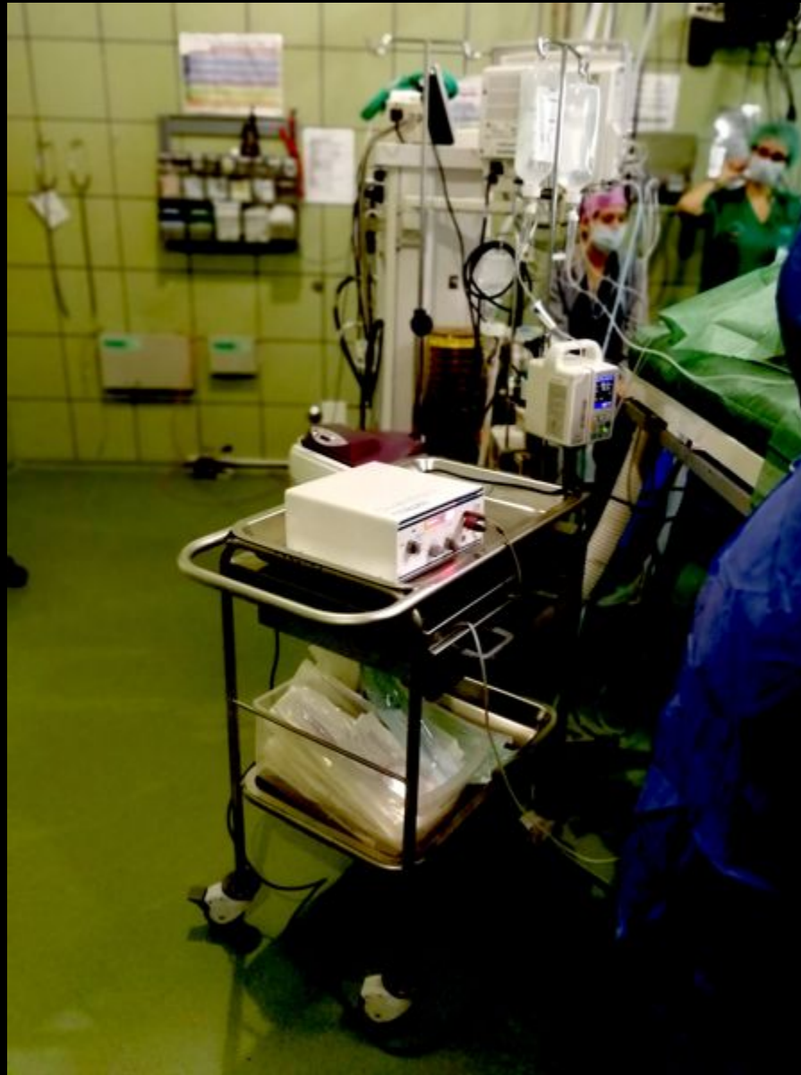
Maquina de monopolar.